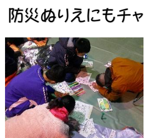
防災ぬりえにもチャレンジ！