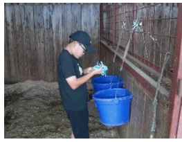
ペアにした洗濯ばさみを 柵とバケツにつける。