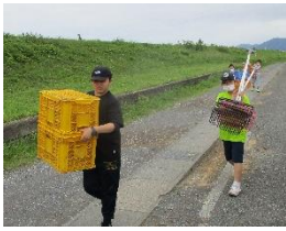
コンテナ、フォークを 母屋から運ぶ。